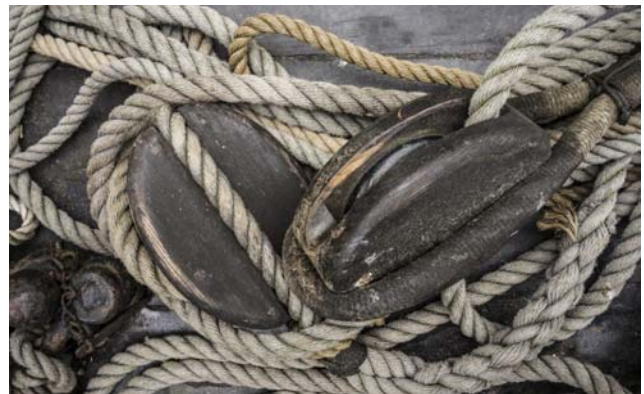
Afbeelding op het informatiebord in de Blokmaaksteech. De Blokmaaksteech herinnert aan een mast- en blokmaakerij die aan de Eewal gevestigd was.

Aanvullende informatie is te vinden in een Elfstegentocht brochure, op de website www.elfstegentocht-woudsend.nl en door gebruik te maken van de QR-code die op elk informatiebord te vinden is. De Elfstegentocht is een belangrijke toevoeging aan de historische informatie voor alle bezoekers van Woudsend.