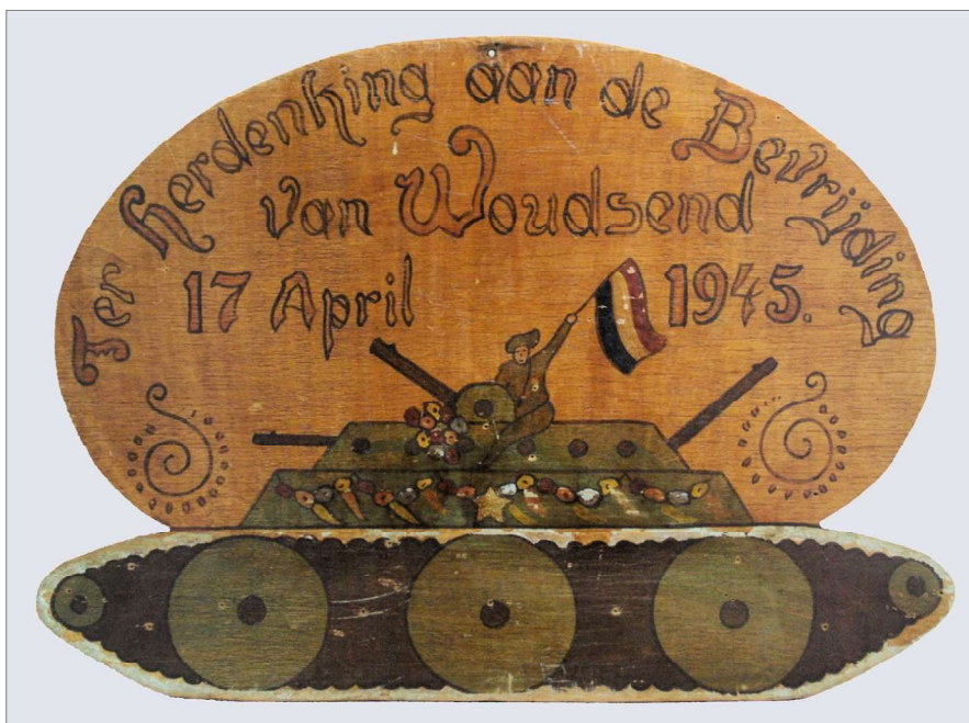
Een door een dorpsgenoot gemaakte herdenkingsplaquette.

Veel dorpsgenoten trokken die dag naar de Straatweg, om de Canadezen te zien met hun tanks, carriers en vlammenwerpers. Maar vooral ook om hen te laten merken hoe blij en dankbaar men was dat zij een eind aan de lange nachtmerrie hadden gemaakt.