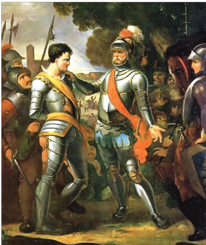
Een gevangen genomen soldaat wordt voorgesteld aan hoofdeling Focke Ukcena.

Volgens de geschiedschrijving is de naam ontstaan in de 15e eeuw, tijdens de Grote Friese burgeroorlog van 1413 tot 1422. Het was de periode van de Friese Vrijheid, een tijd waarbij hier geen centraal gezag was van een graaf of hertog. Regionaal waren er wel sterke mannen, de zogenaamde hoofdelingen, die het voor het zeggen hadden over een gebied of stad. Zij hadden hun eigen legertje en waren regelmatig in conflict met elkaar om hun macht te vergroten. Daarbij sloten ze ook bondgenootschappen over en weer, waardoor er twee rivaliserende partijen ontstonden: de Schieringers en de Vetkopers. Op 11 juli 1420 stonden deze partijen tegenover elkaar in de veldslag van Sloten. De Vetkoper hoofdeling Focke Ukcena belegerde de stad die steun kreeg van de Schieringers.