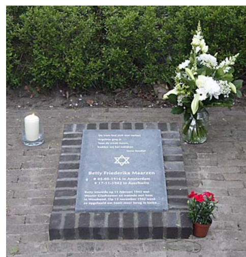
Op initiatief van de Historische Kring is op 4 mei 2012 een gedenksteen bij het oorlogsmonument onthuld.

Met de opbrengst van de adopties worden educatieve activiteiten gefinancierd, zoals het project om schoolklassen kosteloos naar Amsterdam te halen voor een bezoek aan het monument en aansluitend een bezoek aan het Holocaust museum, de Hollandse Schouwburg of het Verzetsmuseum.